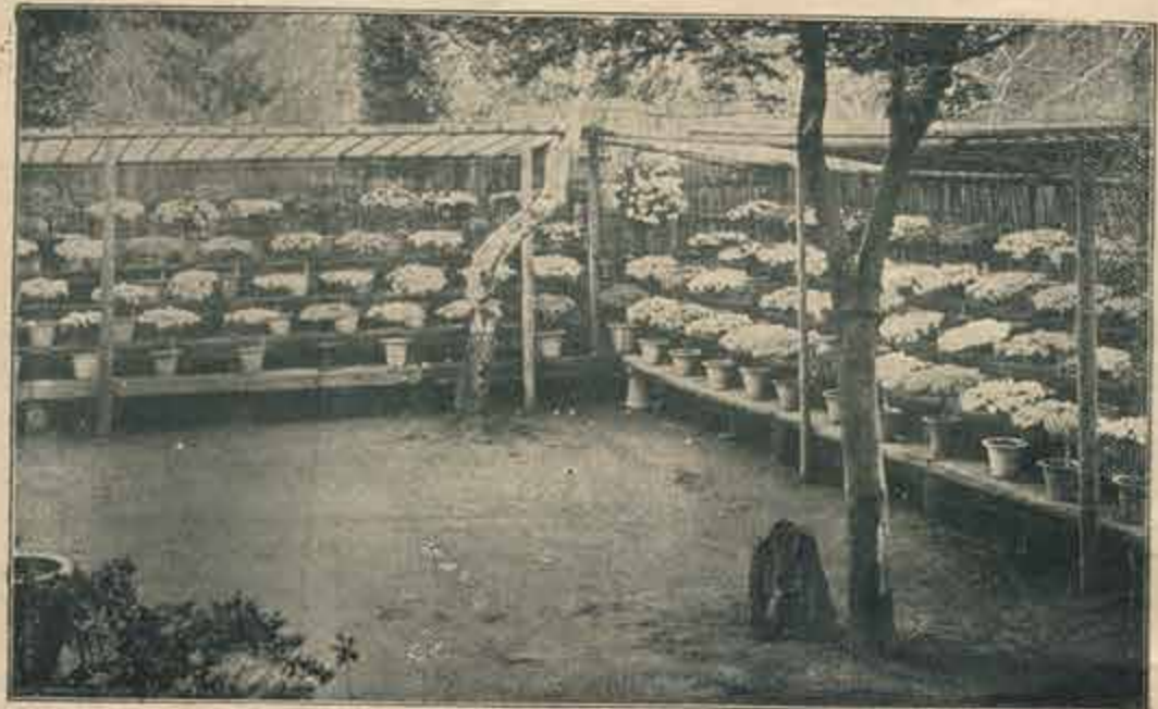
開樂園錦光花満花ノ況