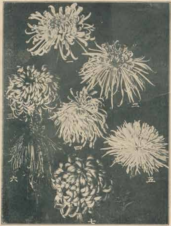
一 千代田ノ雪 二 黄金司 三 六稻三畧 四 世々撰 五 八重ノ雪 六 見 鷲